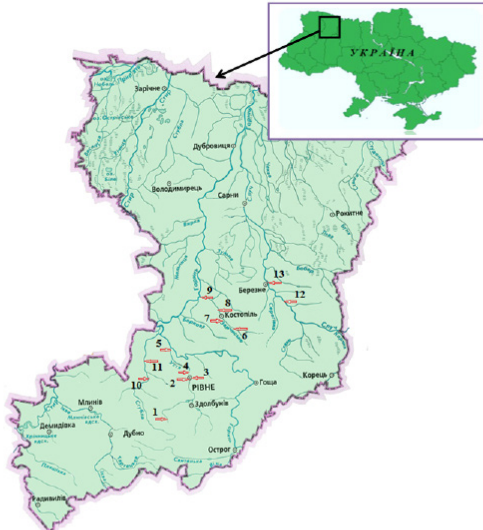
Рис. 1. Ситуаційна карта-схема розміщення контрольних створів відбору донних відкладів у річках Рівненської обл.

екологічний стан між собою у різні періоди року. Факторний аналіз, що передбачав встановлення коефіцієнтів варіації, кореляції та детермінації між експериментальними ознаками проводився в рамках програмного пакету Excel.